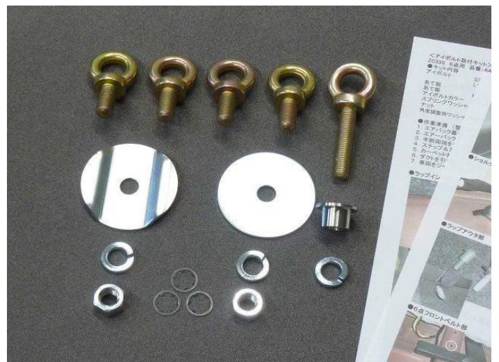
ZC33スイフトスポーツ専用 5点式キット AA1215