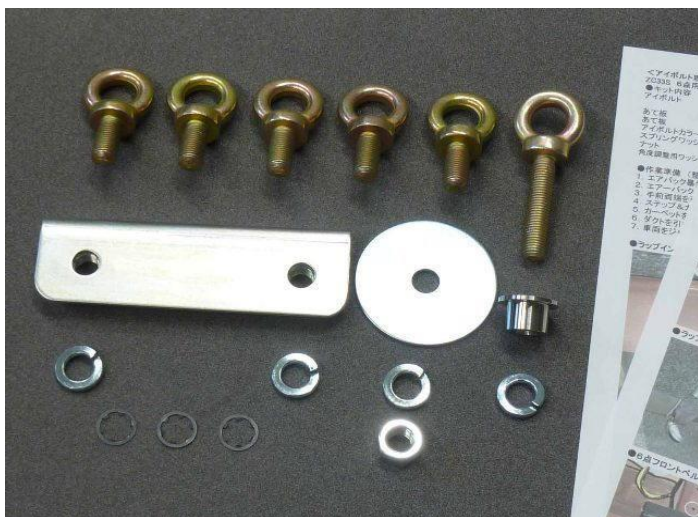
ZC33スイフトスポーツ専用 6点式キット AA1216