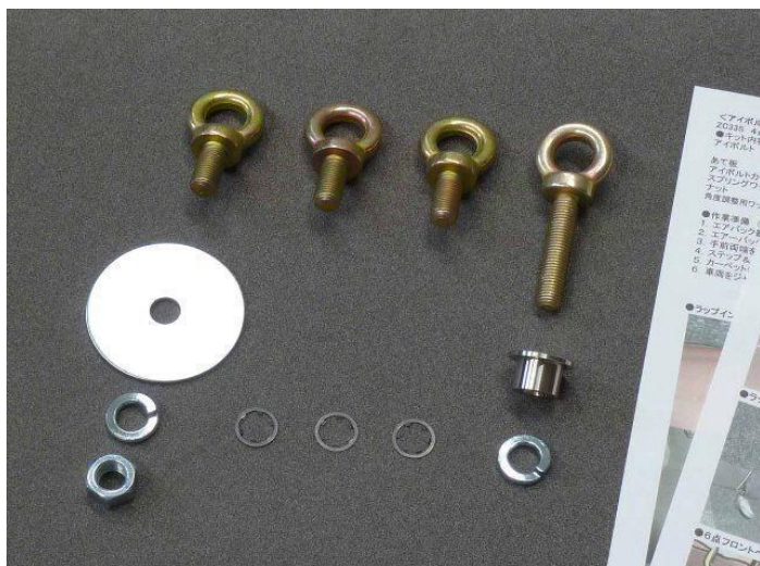
ZC33スイフトスポーツ専用 4点式キット AA1214