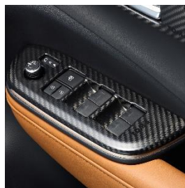
ドアスイッチパネル