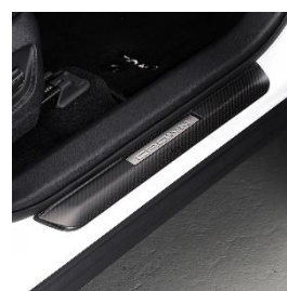
スカッフプレート